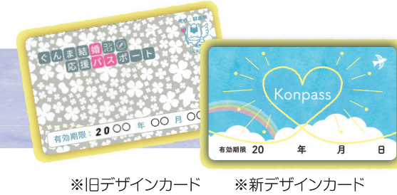
※旧デザインカード ※新デザインカード