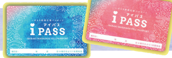
※新婚夫婦用カード ※結婚予定カップル用カード